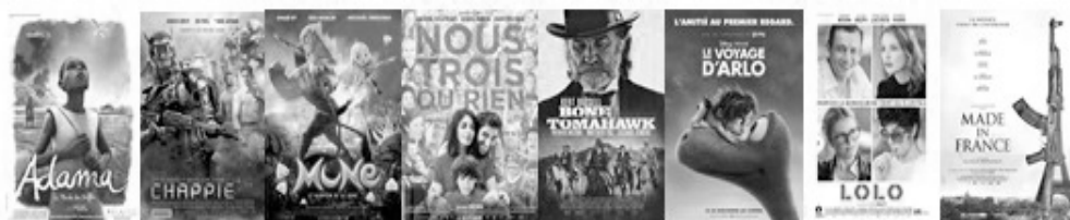
Quelques nouveautés DVD à la médiathèque

Des pc, imprimantes, scanners, tablette sont en libre accès gratuitement. Seules les impressions sont payantes.