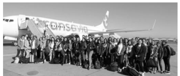
Stage professionnel pour 46 jeunes lycéens du Pays de Redon au Maroc

« Un pays magnifique, des partenaires marocains heureux de nous recevoir, satisfaits par les initiatives que nous avons prises lors des animations dans les écoles. Un accueil formidable dans TOUTES les structures marocaines où nous étions attendus, malgré le rythme soutenu. Un dépaysement et un enrichissement uniques. »