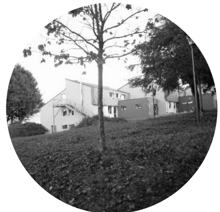
Internat IME -ITEP

Directeur Association La Bouselaie Fandguelin & EMS Fandguelin